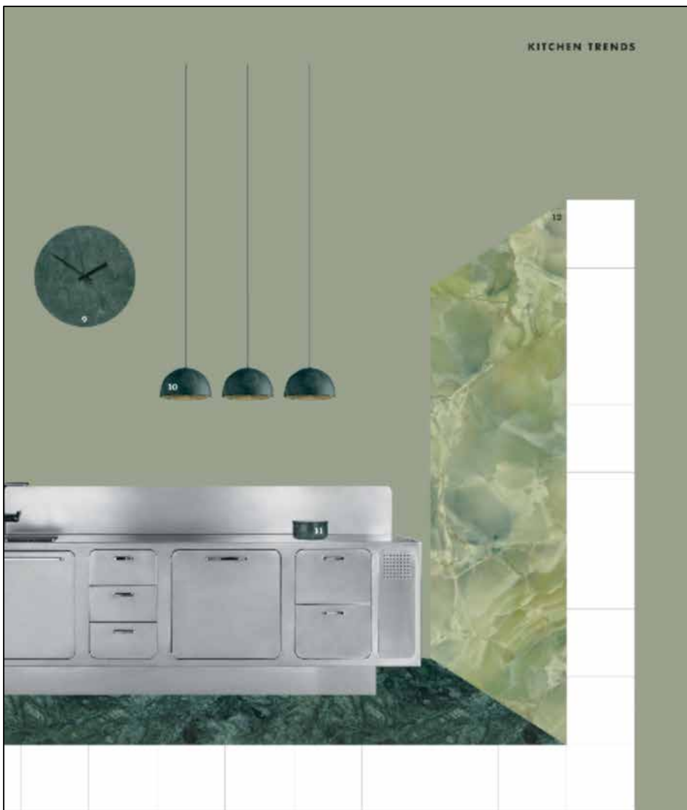
17 Pittore 9740 by Massimo Koppa, €8.500, Georg Jensen ( www.georgjensen.com ) 18 Ego kitchen by Alberto Tomba, €33.075, Abimis ( abimis.com ) 9 Green marble wall clock by Fabiana, €73, Lupo ( www.lupo.com ) 10 Moris pendant lights by Wang Lachen, €339 each, Acasa ( www.acasa.com ) 11 Vitali bowl by Louise Fox, €64, Royal Delft ( www.royaldelft.com ) 12 Green marble , from: £40 per square metre, Firenze Architectural Surfaces ( www.firenze.com ) 13